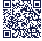
LISTA DE EMBARCAÇÕES AUTORIZADAS E MAIS INFORMAÇÕES