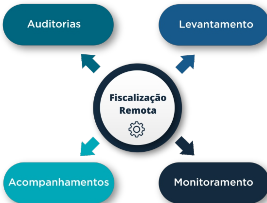
Figura 1 - Instrumentos de fiscalização remota.

As Fiscalizações in loco deverão ser devidamente motivadas por resultados verificados nas fiscalizações remotas ou por demandas externas ou internas (Notícias de Fato ou identificação de indícios de infração no exercício das atividades rotineiras da Agepar).